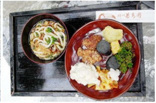
おいしそうなバイキングの昼食。